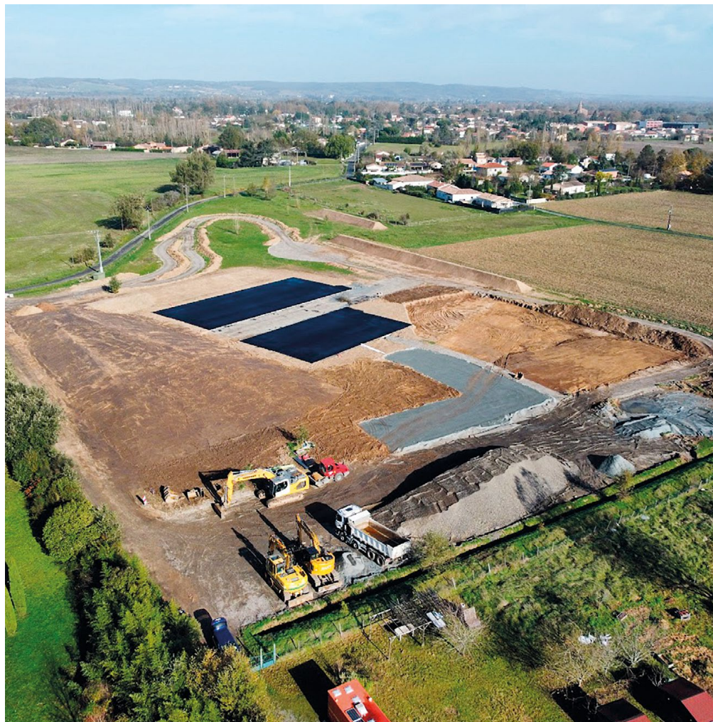
+ PHOTO AÉRIENNE PENDANT LES TRAVAUX