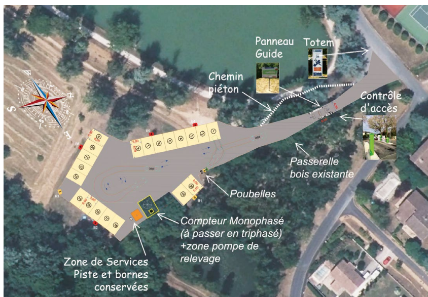
+ PLAN DU PROJET

Chaque séjour donne lieu à une contribution directement versée à Camping-Car Park, dont les deux tiers rétrocédés à la commune, garantissant ainsi un modèle durable et équitable. Un projet concret, utile et ambitieux : pour que les camping-caristes profitent d'un site accueillant, fonctionnel et serein, à l'image de l'esprit de notre ville.