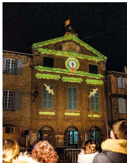
+ MAPPING SUR LA FAÇADE DU CENTRE CULTUREL