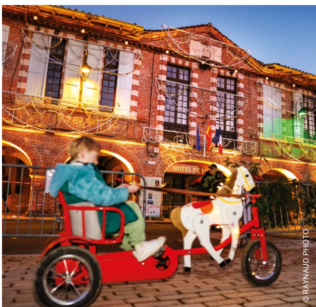
+ LES SULKYS