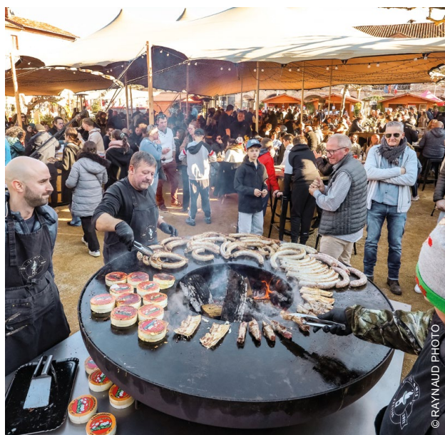
+ LE BRASERO