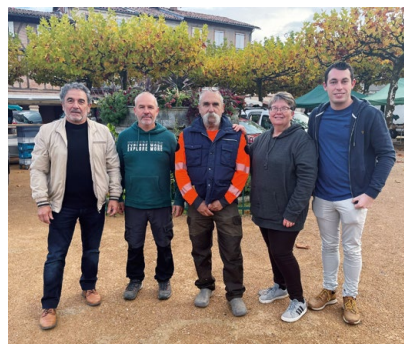
+ LES MEMBRES DU COMITÉ CONSULTATIF DU MARCHÉ ET LE PLACIER

Pas de bouleversement pour ce marché qui restera dans un esprit de continuité, un lieu de rencontres et de convivialité pour tous le dimanche matin.