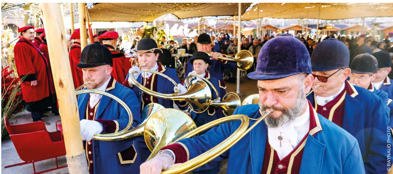
+ LES INTRONISATIONS À LA CONFRÉRIÉ DE LA DIVE BOUTEILLE DE GAILLAC