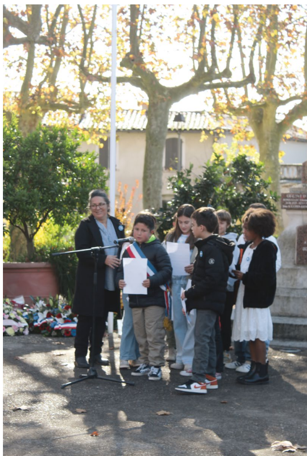
+ LES ÉLUS DU CMJ