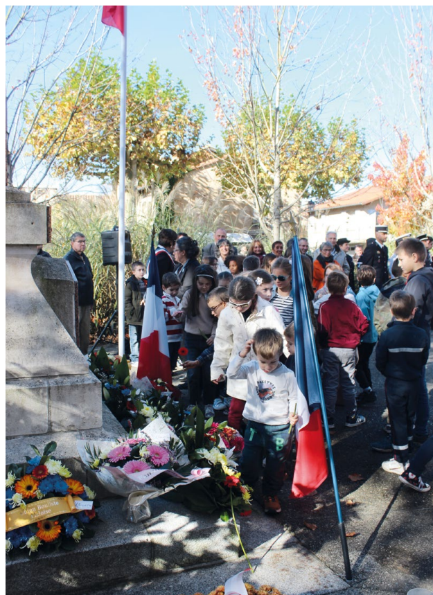
+ LES ENFANTS