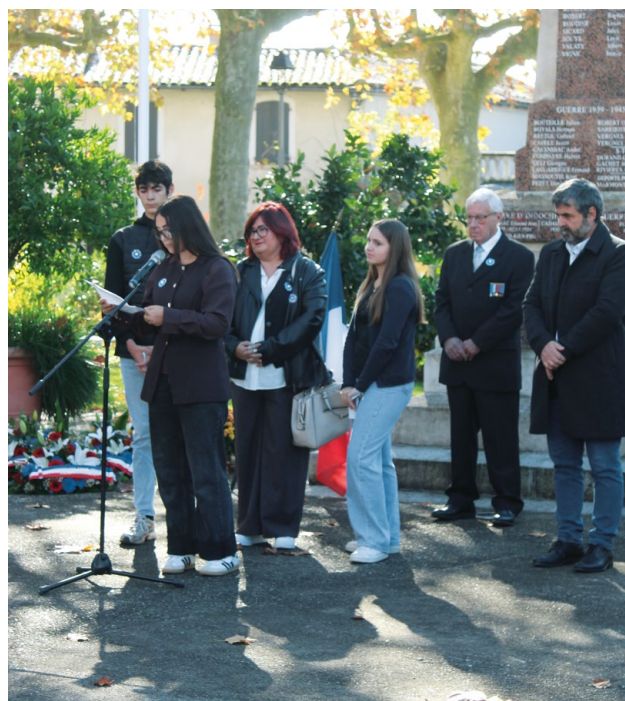
+ LES COLLÉGIENS

Et sans oublier, les enfants des écoles, venus nombreux pour déposer une fleur à la mémoire des Morts pour la France.