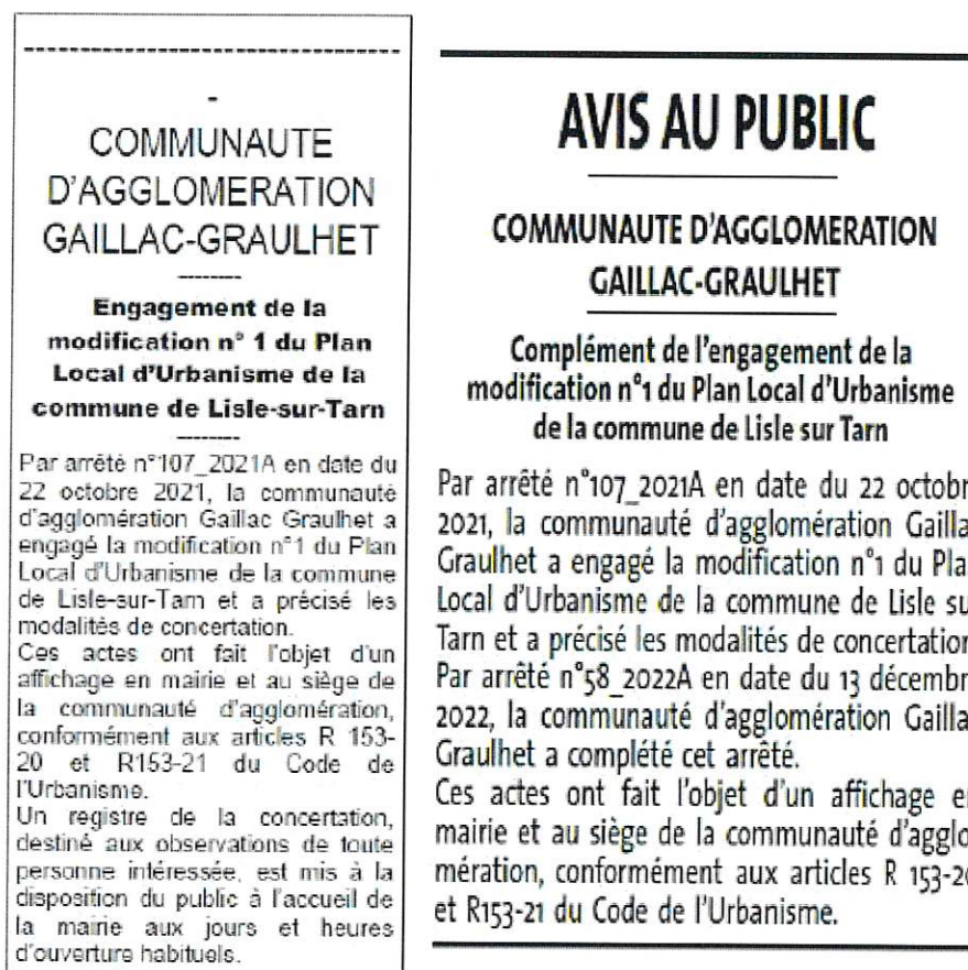
Figure 1 / extraits des parutions dans la Dépêche du Midi et dans le Tarn Libre

L'engagement de la modification du PLU ainsi que les modalités de concertation ont été publiées dans les journaux locaux.