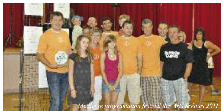
Meilleure programmation festival des Arts Scénics 2011