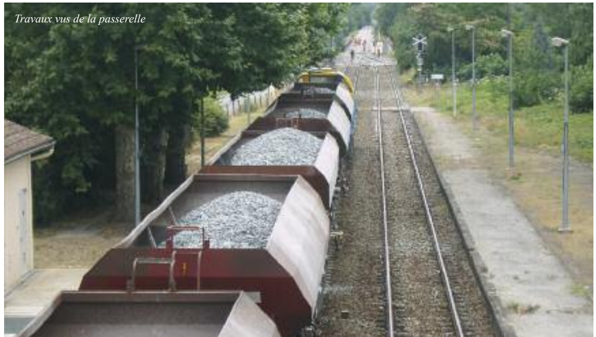
Travaux vus de la passerelle

Pour la municipalité lissoise, il s'agissait donc d'adapter les infrastructures