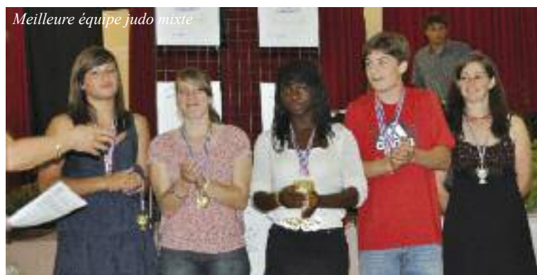
Meilleure équipe judo mixte