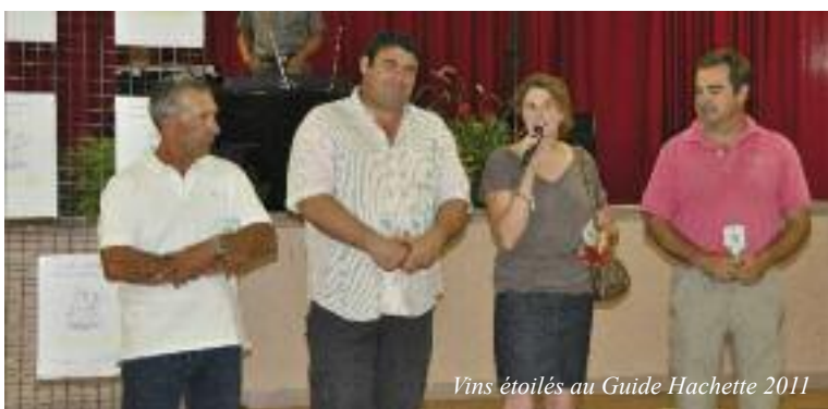
Vins étoilés au Guide Hachette 2011