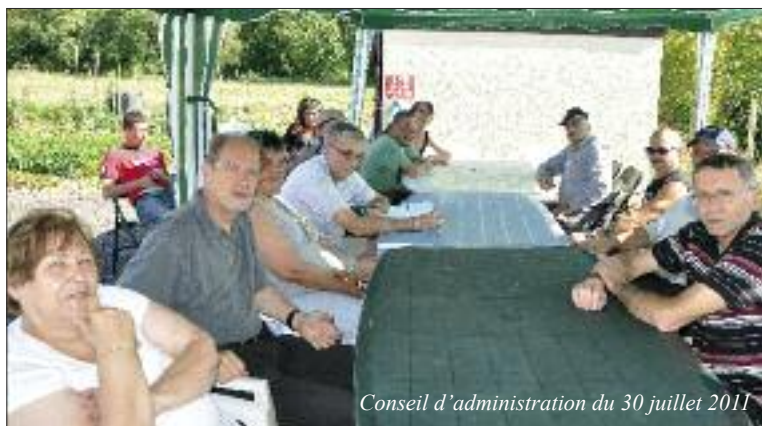
Conseil d'administration du 30 juillet 2011