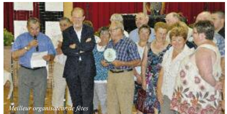
Meilleur organisateur de fêtes