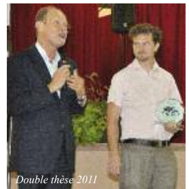
Double thèse 2011