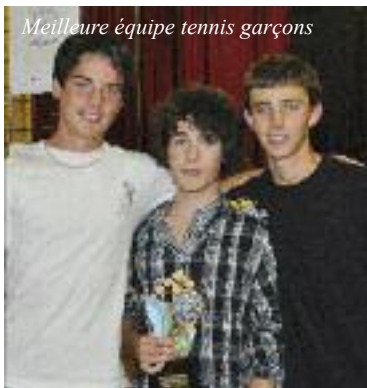
Meilleure équipe tennis garçons