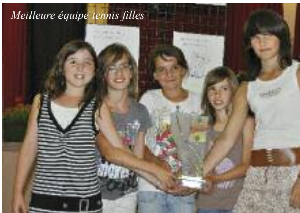
Meilleure équipe tennis filles

Non, non et non... la municipalité lisloise n'est pas une adepte de la méthode Coué qui rabâche, chaque année, que "les MEILLEURS sont à LISLE" pour... influencer sur la progression démographique de la cité ou, tenter de remonter le moral d'une population défallante !